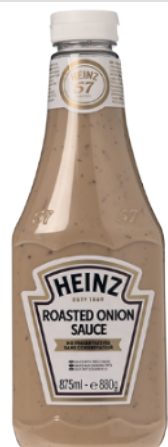
Mise en Oeuvre